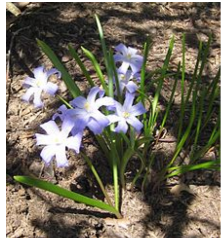
Gewöhnlicher Schneestolz ( Chionodoxa luciliae )