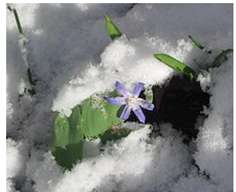
Gewöhnlicher Schneestolz ( Chionodoxa luciliae ) im Schnee

Eine Naturhybride ist Chionodoxa siehei × Chionodoxa luciliae .