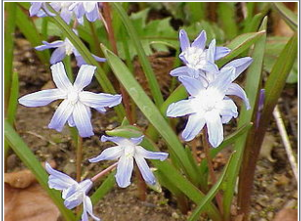
Große Sternhyazinthe ( Chionodoxa forbesii )